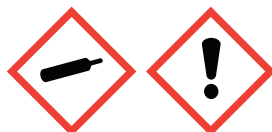
Compressed Gas Exclamation Mark

Flammable Liquids: Category 4 Acute toxicity; inhalation: Category 4 Compressed Gas, Liquified Gas, Dissolved Gas Serious eye damage/eye irritation: Category 2B Acute toxicity; dermal: Category 5 Specific target organ toxicity, single exposure; Respiratory tract irritation: Category 3