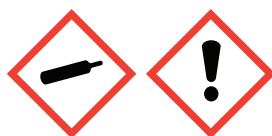
Compressed Gas Exclamation Mark

Flammable Liquids: Category 4 Acute toxicity; oral: Category 4 Compressed Gas, Liquified Gas, Dissolved Gas Serious eye damage/eye irritation: Category 2B Skin corrosion/irritation: Category 3