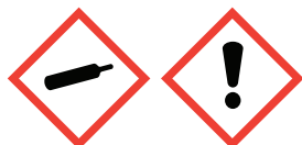
Compressed Gas Exclamation Mark

Flammable Liquids: Category 4 Acute toxicity; inhalation: Category 4 Compressed Gas, Liquified Gas, Dissolved Gas Serious eye damage/eye irritation: Category 2B Acute toxicity; dermal: Category 5 Specific target organ toxicity, single exposure; Respiratory tract irritation: Category 3